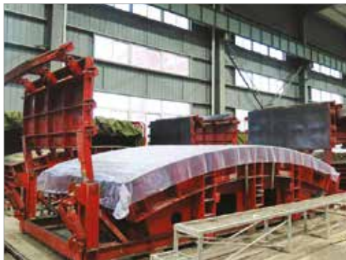
СЕГМЕНТ ДЛЯ ПРОКЛАДКИ ТУННЕЛЕЙ